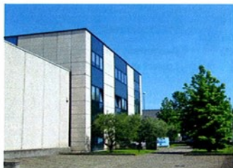
La sede di Filmar, in provincia di Brescia

Filoscozia? Un marchio ancora forte, che mantiene inalterata la connotazione di cotone di qualità. A dimostrarlo sono un'indagine di mercato e diversi sondaggi B2B e B2C promossi da Filmar e Olcese (a oggi uniche realtà depositarie della tecnologia necessaria per realizzare questo prodotto),